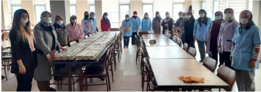
İskilipli Atıf Hoca KYK Kız Yurdu 'nda karantina süreçlerini geçiren vatandaşlara mantı ikram edildi.

KYK personeli karantinadaki misafirleri için Çorum mantısı açtı